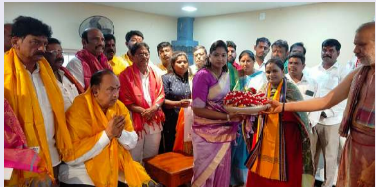
సూక్ష్మార్చనపేట, చిత్తూరు ఎక్స్ ప్రెస్, ఏప్రిల్ 20: