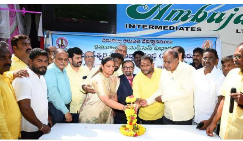
కుప్పం, చిత్తూరు ఎక్స్ ప్రెస్, ఏప్రిల్ 20: