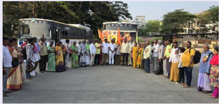
కుప్పం, చిత్తూరు ఎక్స్ ప్రెస్, ఏప్రిల్ 20: