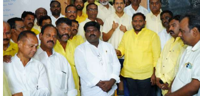
కుప్పం, చిత్తూరు ఎక్స్ ప్రెస్, ఏప్రిల్ 20:

తెలుగుదేశం పార్టీ జాతీయ అధ్యక్షుడు, రాష్ట్ర ముఖ్యమంత్రి నారా చంద్రబాబు నాయుడు జన్మదినం సందర్భంగా కుప్పం పట్టణంలోని సోమవారం విభిన్న కార్యక్రమాలు ఘనంగా నిర్వహించారు. పట్టణంలోని శ్రీ రామలవారి దేవాలయంలో ప్రత్యేక పూజలు నిర్వహించి, ఆనంతరం స్థానిక అన్న క్యాంపైన్లో ఉచిత అన్నదాన కార్యక్రమం చేపట్టారు. హంద్రీనీవా దావూ కుప్పం చెరువుకు చేరుకున్న కృష్ణా జలాలను స్నానిక మహిళలు బిందెలతో సేకరించి రాళ్ళిగా తీసుకెళ్లి, 50 అడుగుల చంద్రబాబు నాయుడు కలోనీలకు అభిషేకం నిర్వహించారు. ఈ కార్యక్రమం ప్రత్యేక ఆకర్షణగా నిలిచింది. తదుపరి కుప్పం పట్టణ చెరువు నుంచి తెలుగుదేశం పార్టీ నాయకులు, కార్యకర్తలు భారీగా బైక్ ర్యాలీ నిర్వహిస్తూ స్థానిక బస్టాండ్ వరకు చేరుకున్నారు. అక్కడే నుంచి పార్టీ కార్యాలయం వరకు ర్యాలీ కొనసాగించి బహిరంగ సభ నిర్వహించారు. ఈ సందర్భంగా 76 కిలోల భారీ కేక్ కట్ చేసి చంద్రబాబు నాయుడు జన్మదిన వేడుకలను ఘనంగా జరుపుకున్నారు. కార్యక్రమాల్లో పార్టీ నాయకులు, కార్యకర్తలు, స్థానిక ప్రజలు పెద్ద సంఖ్యలో పాల్గొన్నారు.