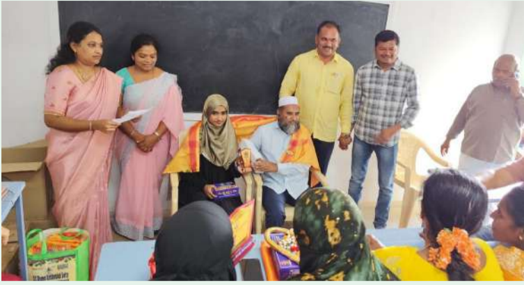
వి.కోట, చిత్తూరు ఎక్స్ ప్రెస్, ఏప్రిల్ 20:

వి.కోట పట్టణంలో ఉన్నటువంటి సివిఆర్ఎమ్, విద్యానికేతన్ ఉమ్మడి కాలేజీలకు సంబంధించిన యాజమాన్యం సోమవారం రోజు విస్తృత రీతిలో సన్మాన కార్యక్రమాన్ని నిర్వహించారు. వివరాల్లోకి వెళితే రెండు కాలేజీలలోను ఉత్తమ మార్కులు సాధించి తమ ఉత్తమ ప్రతిభను ఘనపరిచినందుకుగాను విద్యార్థులకు, వారి తల్లిదండ్రులను కాలేజీలో సన్మానించారు. కార్యక్రమంలో ఉమ్మడి కాలేజీల యాజమాన్యంతో పాటు ప్రెస్ బిరో యుగంధర్ రెడ్డి మరియు అధ్యాపకులు బృందం విద్యార్థులు తల్లిదండ్రుల పాల్గొన్నారు.