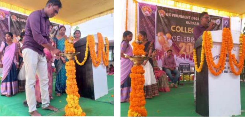
కుప్పం, చిత్తూరు ఎక్స్ ప్రెస్, ఏప్రిల్ 20: